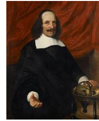
Portret van Dr Jan (Joan) Willemsz. Blaeu uit 1663 door Jan van Rossum (collectie Amsterdam Museum)