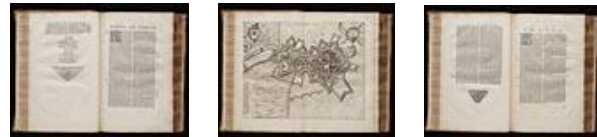
Pagina's uit Toonneel der steden van 's Konings Nederlanden, met hare beschrijvingen, uitgegeven by Joan Blaeu.