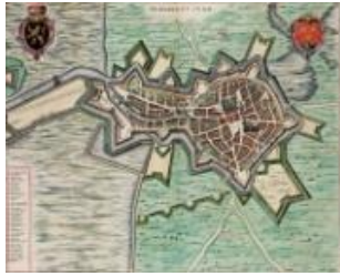
Plattegrond van Berghen op Zoom verschenen in een atlas van J. Blaeu uit 1649