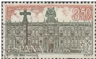
Klooster San Marcos

In het voormalige San Marcos-klooster werden vroeger de pelgrims opgevangen, maar tegenwoordig is er een museum en een sjiek hotel in gevestigd.