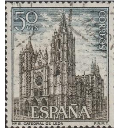
Kathedraal Pulchria Leonina

De gotische kathedraal Pulchria Leonina, bouw 12 de tot 14 de eeuw door Alphons IX van León, is prachtig.