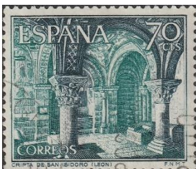
Crypte in de basiliek San Isodoro

De Real Basilica de San Isodoro (11 de eeuw) is een van de vroegste Romaanse bouwwerken van Spanje. In de crypte is een koninklijke begraafplaats en heeft Byzantijnse fresco's.