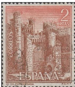
Tempeliersburcht in Ponferrada

Na Astorga krijgen we een aantal glooiende wegen die langzaam aan uitgroeien tot flink klimmende wegen met een stijgingspercentage van 10 tot 20%. Na lang klimmen komen we bij het beroemde Cruz de Ferro; een ijzeren kruis op een berg losse stenen. Haast iedere pelgrim legt hier een meegebrachte steen op deze berg om op deze manier symbolisch een last af te leggen. Nog even klimmen om op het hoogste punt van de Irago-pas, 1510 meter, uit te komen. Daarna volgt de afdaling; dat is knijpen; zowel figuurlijk als letterlijk (in de remmen). Ondanks het remmen ga je met 50 km/uur naar beneden.