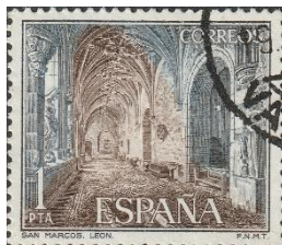
Kruisgang San Marcos

In het voormalige San Marcos-klooster werden vroeger de pelgrims opgevangen, maar tegenwoordig is er een museum en een sjiek hotel in gevestigd.