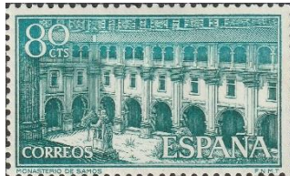
Kloostergang Monasterio San Julián de Samos

In Samos is een eenvoudig onderkomen voor de pelgrims bij de paters Benedictijnen in het Monasterio San Julián de Samos.