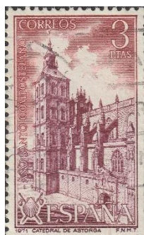
Kathedraal Santa Maria

Hier zien we weer een afbeelding van St. Jacob, de Morenododer. Naast de kathedraal staat een prachtig bisschopshuis ontworpen door Gaudi.