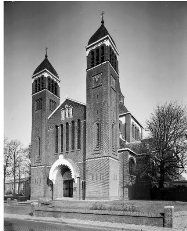
Sint Quirinuskerk in Halsteren