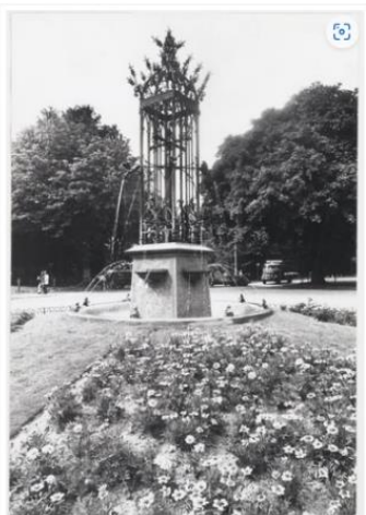
De fontein in 1972.

Het waterige parapedaardje van de straat van 't Rijks en de muziekschool is de fontein in het midden van de laan. Deze fontein is in 1914 gemaakt door Janus Dingemans.