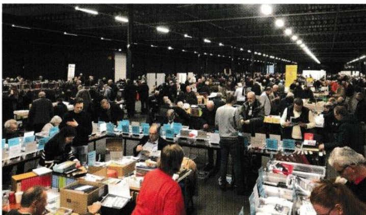
Oudjaarsbeurs Houten 5500m2 verzamelplezier (foto december 2022).

Geopend 28/12 9.30-17 uur / 29/12 09.30-16 uur